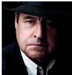
John Banville continua a lidar com o complexo de culpa católico

Neste romance, o autor parece ainda querer provar, mais uma vez, que nunca se sai impune dos momentos de felicidade absoluta sem a posterior “factura” que pode ser bem dura. Em entrevistas, Banville tem referido a forte influência da sua educação católica que “bem cedo instila na cabeça das crianças o complexo de culpa”. Para Alex Vander, terminada e arrumada a sua inocência, e na incapacidade assustadora de parar o tempo, o mundo transforma-se num lugar bem mais hostil, onde filhas amadas desaparecem para todo o sempre e onde não há espaço para o amor, apenas para a cumplicidade. Nem mesmo a tentativa falhada de “substituir” Cass por Dawn Davenport, a frágil, friorenta, desamparada (e também suicida) actriz com quem contracenava, lhe pode trazer consolo. Só lhe resta visitar as memórias e quedar-se naquele lugar onde volta sempre, enrodilhado no chão como um cão fiel, junto à cama da mãe, os dedos desta tocando-lhe os cabelos, num eterno gesto de protecção.