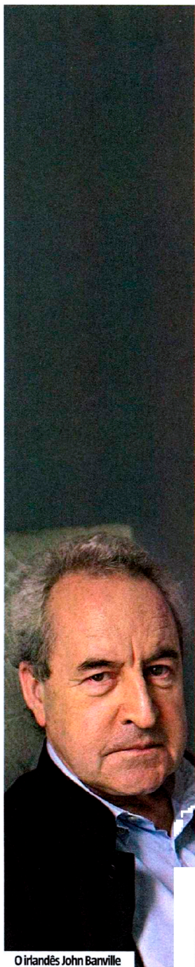
O irlandês John Banville

baum, uma forma rara de esquizofrenia. Nenhum dos dois acredita na imortalidade da alma, mas, depois do desastre de Portovenere, na Ligúria, estão a um passo de admitir a existência "de um mundo para além deste". A morte de Cass trouxe consigo a notícia de uma gravidez ignorada e, por associação, o nome de Axel Vander.