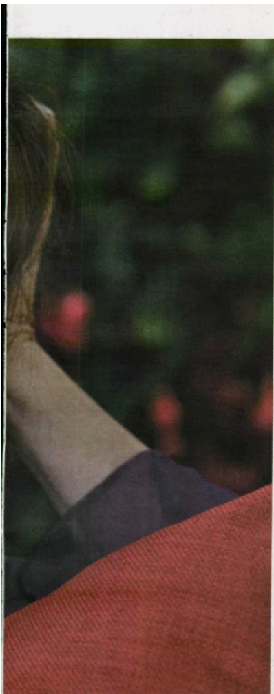
Isabel Allende, que desde 1981 começa os seus livros a 8 de Janeiro, já publicou 19 romances