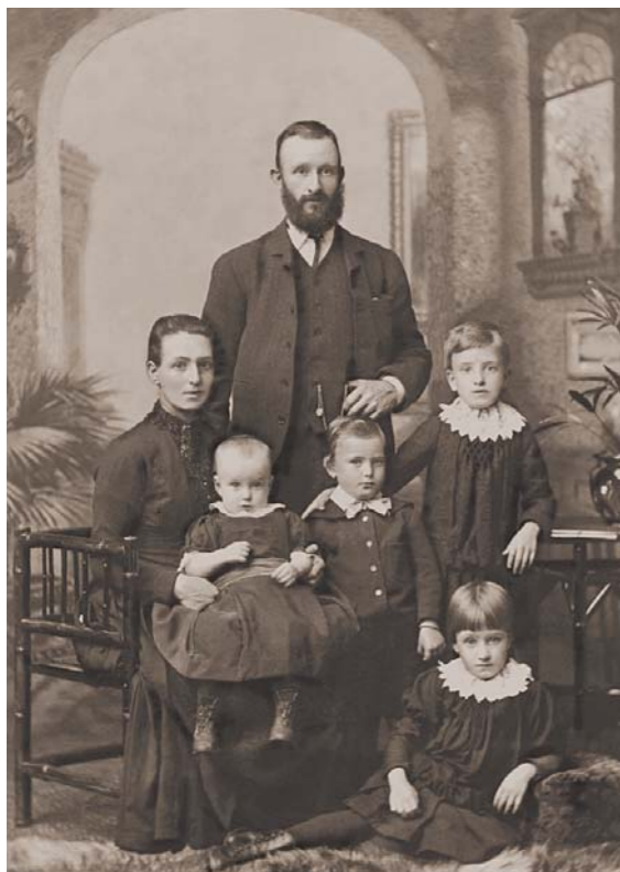
Família patriarcal – dominância da figura masculina.

em casa dos pais do esposo), e transmitindo-se, de pai para filho, o nome, os bens e os privilégios. Na filiação matrilinear , a autoridade pertence não aos filhos nem aos maridos, mas aos homens do grupo social da mãe (tios e irmãos), sendo a residência matrilocal (instalação em casa dos pais da esposa); Por filiação bilinear – a que se verifica na nossa sociedade – entende-se aquela em que todos os descendentes recebem o nome do pai e da mãe, podendo perdê-lo após o casamento e podendo todos receber a herança de qualquer um dos avós;