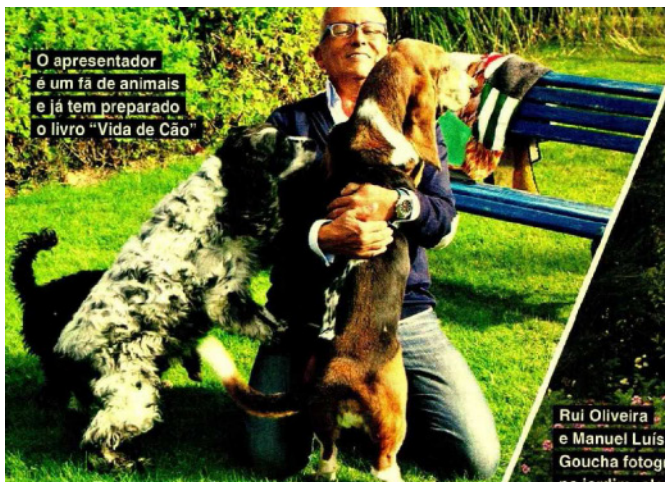
O apresentador é um fã de animais e já tem preparado o livro "Vida de Cão"