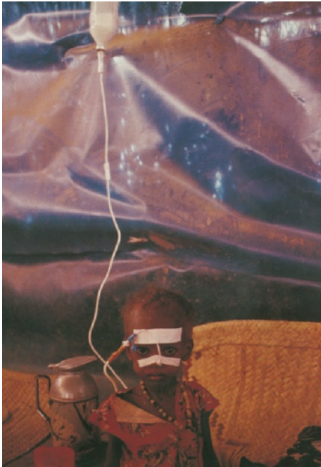
> Ação humanitária levada a cabo pelos Médicos Sem Fronteiras (GEO).

Embora todas as ONG internacionais emanem diretamente da sociedade civil, muitas beneficiam do apoio dos Estados, nomeadamente para porem em prática os seus programas, mas contam também, em boa parte, com financiamento e apoio resultante de donativos que podem ser provenientes de empresas privadas ou de doações da população em geral.